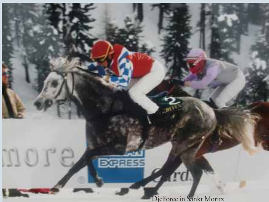
Djelforce in Sankt Moritz

Huub had snel door dat je met Franse bloedlijnen moest werken om voorop te lopen en hij vertelt als anekdote: 'Ik ging dus een kijkje nemen bij de Kossack Stud, toen de eerste stoeterij in