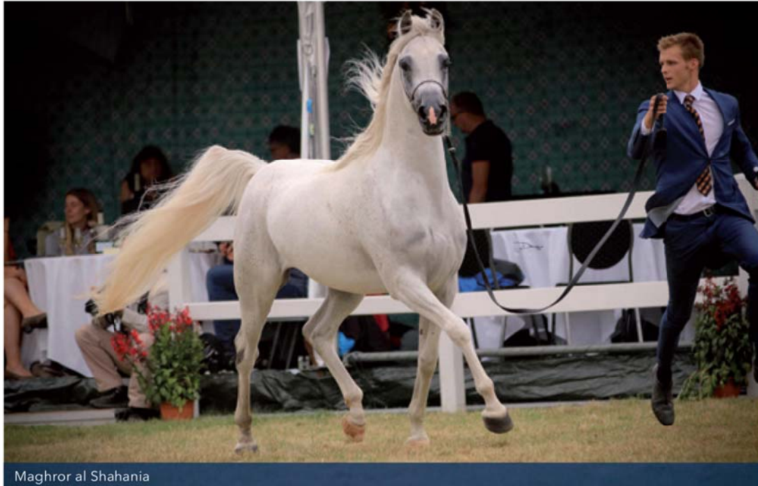
Maghror al Shahania