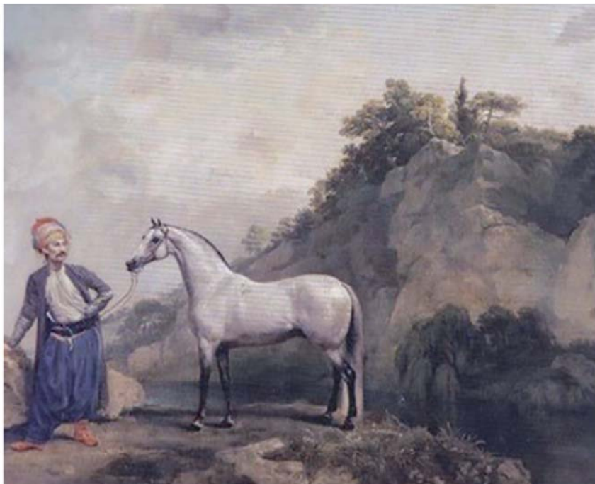
De Turkse schimmel van de hertog van Ancaster met een Turkse stalknecht in Creswell Crags, c. 1763-1764 door George Stubbs Doek, 101 x 126,8 cm. The Trustees of the Grimsthorpe and Drummond Castle Trust Limited