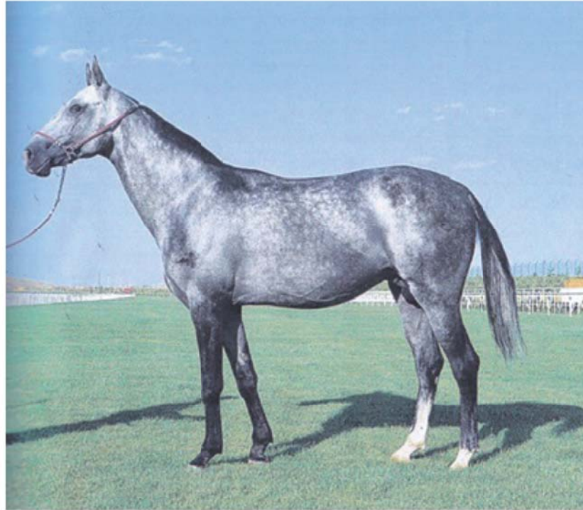
Peycam, grijze hengst, geboren in 1997 vader; Gajar (Alvan x Ajap) moeder: Novgul (Kerem x Garagum) In 1999-2002 nam hij deel aan 22 rennen en was 15 x winnend of geplaatst. Uit: The President's Horses, Elite of Akhalteke Breed Ashabad, 2003

Arabisch paard zijn dat via Turkije Engeland bereikte, maar het kon ook een Turkmeen zijn. Zo was een als 'Barb' omschreven paard misschien een Berber maar het kon ook een al dan niet zuivere Arabier zijn die via de Noord-Afrikaanse kust naar Engeland was gekomen.