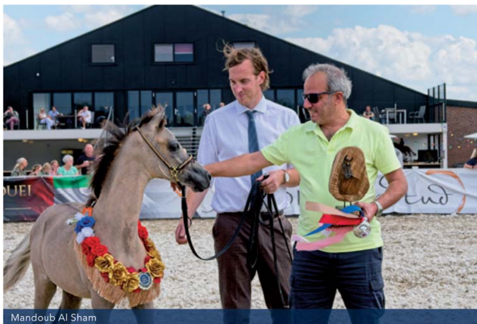
Mandoub Al Sham