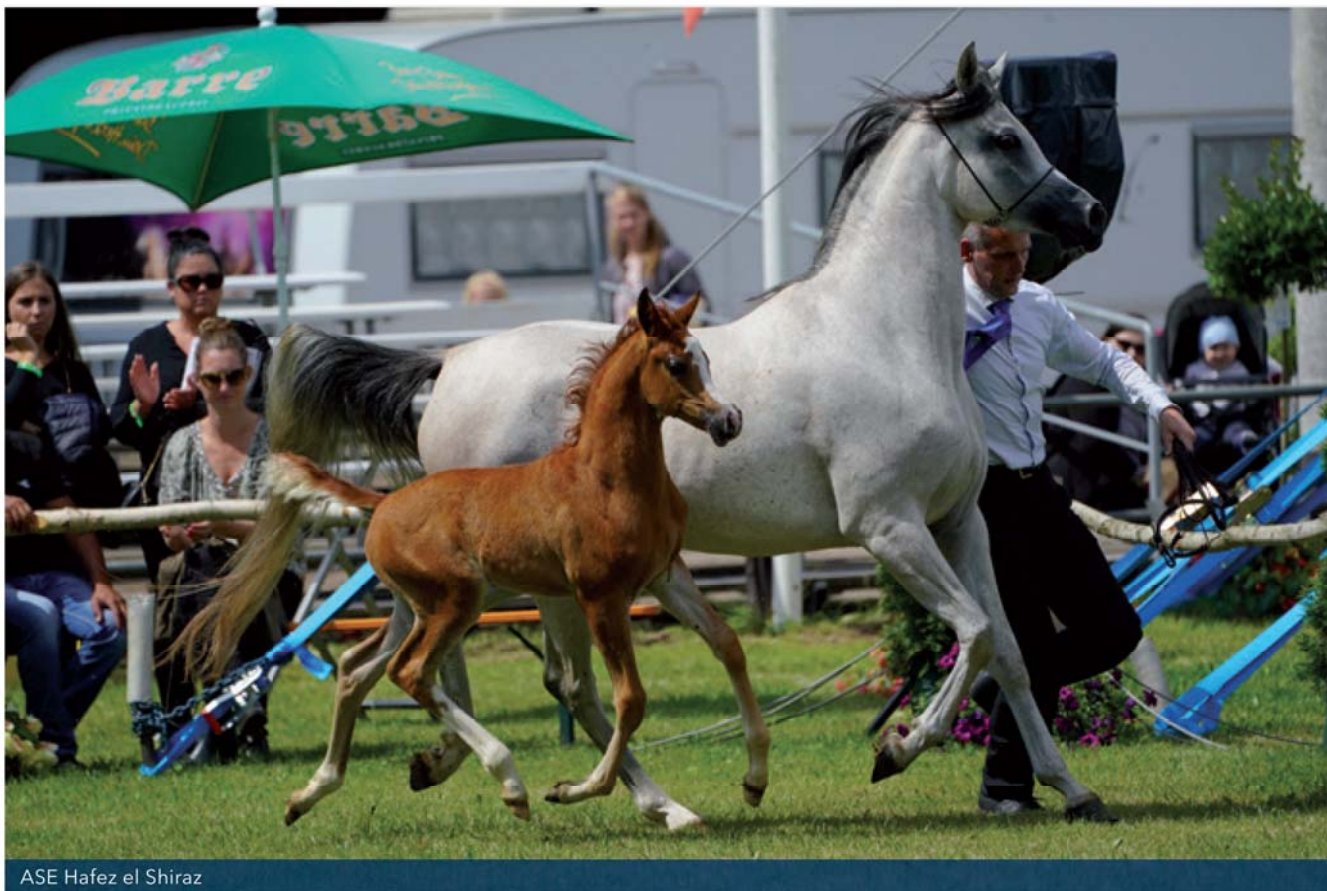
ASE Hafez el Shiraz