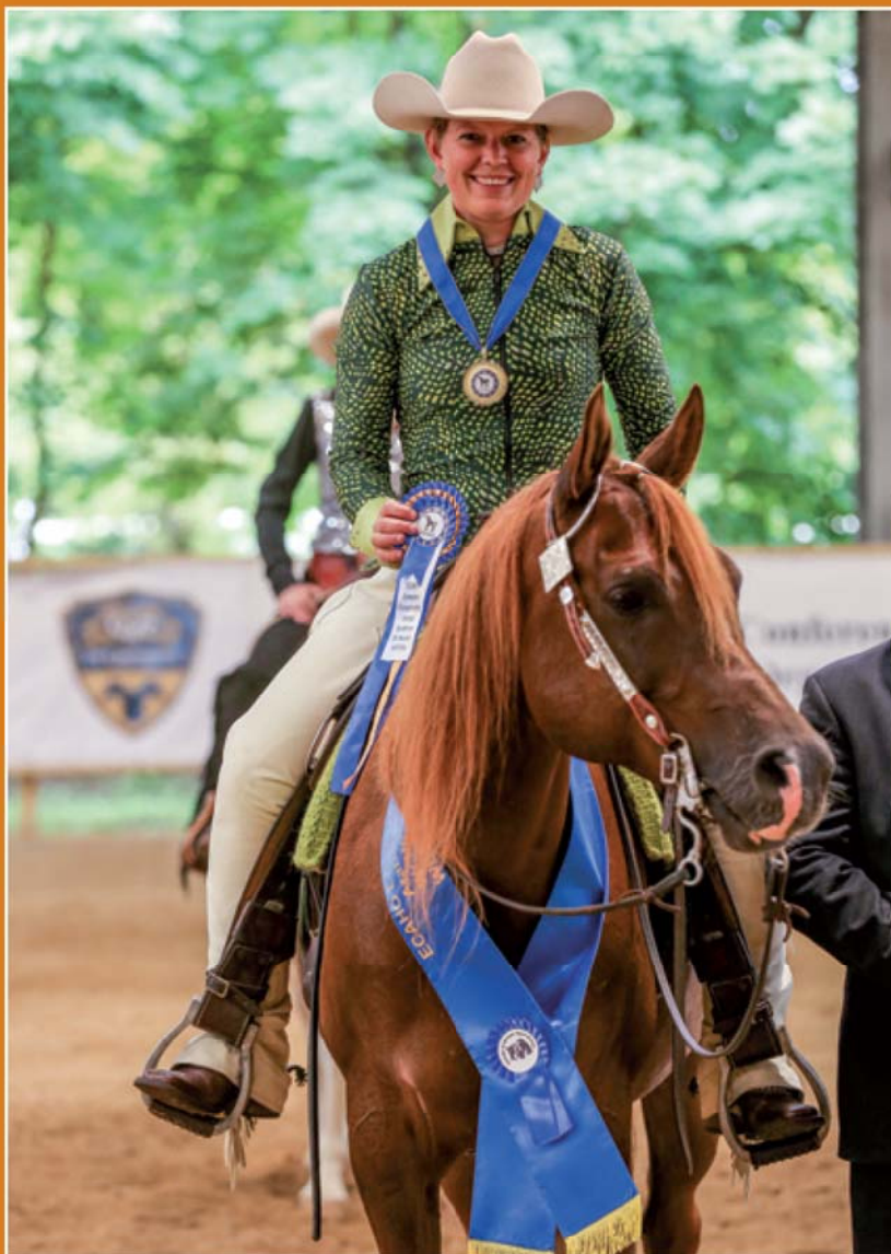
Canisia Romani & Ashraf al Shams (Ajman Moniscione x Esstonia) EUROPEES KAMPIOEN WESTERN PLEASURE 2020 RESERVE ALLROUND CHAMPION 2020 ECAHO European Championships for Arabian Sporthorses