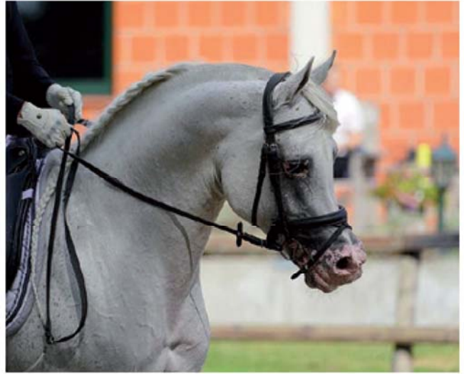
Uitslagen dressuur IJzerlo