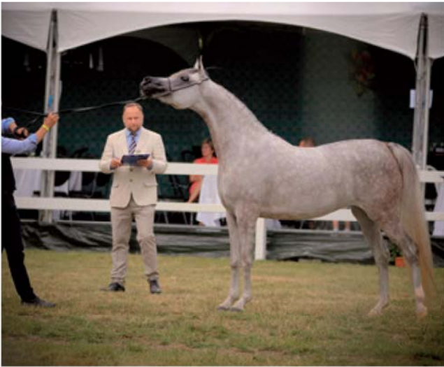
Nederlandse successen op de Elran Cup