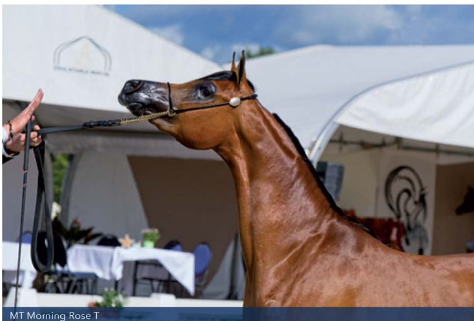
MT Morning Rose T

Zes van de zeven inschrijvingen verschenen in de rubriek voor tweejarige merries groep A, waarvan er vijf Internationaal en twee enkel Nationaal deelnamen. Hier was het de zeer verfijnde vos Inayah RC (RFI Farid x