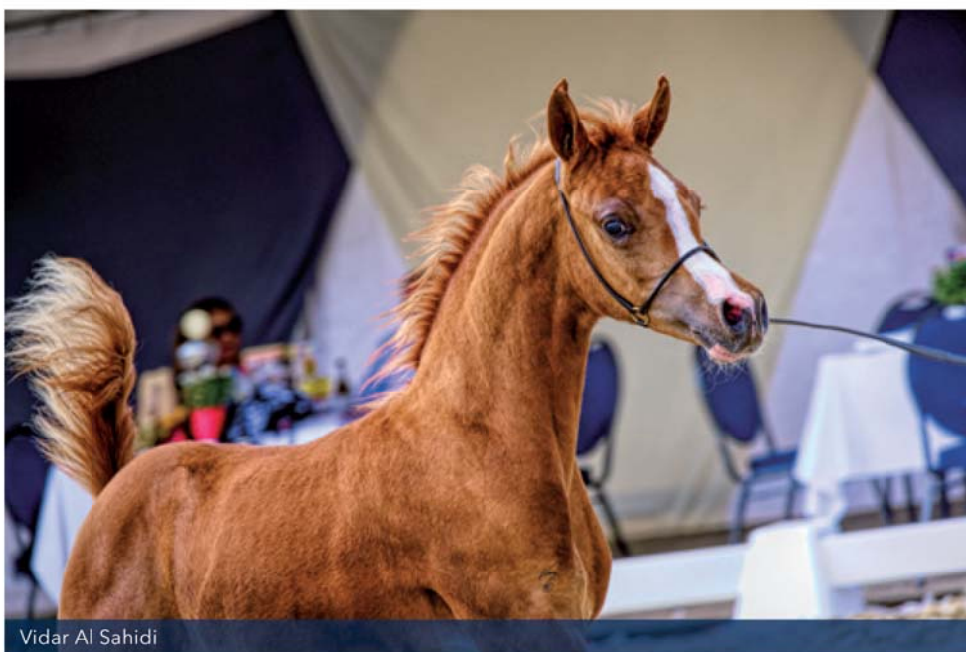
Vidar Al Sahidi

Met alle rubrieken voor junior merries achter de rug, eindigde de zaterdagochtend met het kampioenschap voor junior merries van de Nationale C Show. De Nationale gouden medaille ging naar de "bay beauty" MT Morning Rose T, gevolgd door IEA Yemaya met de zilveren medaille en Silver Starlight BJ die het brons